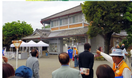
女工館 明治6年建築 当時の日本建築にはない特徴